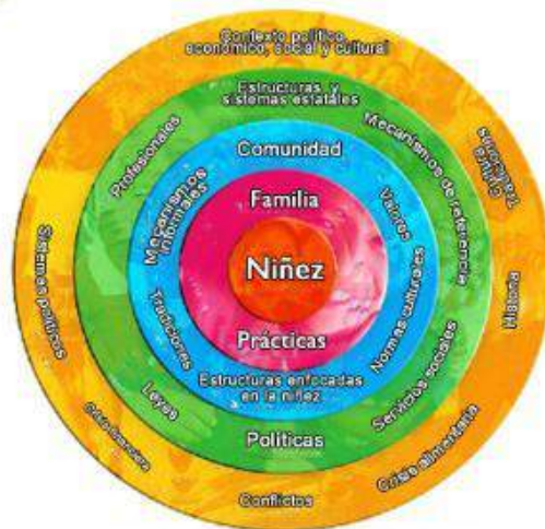
Modelo ecológico de protección a la niñez